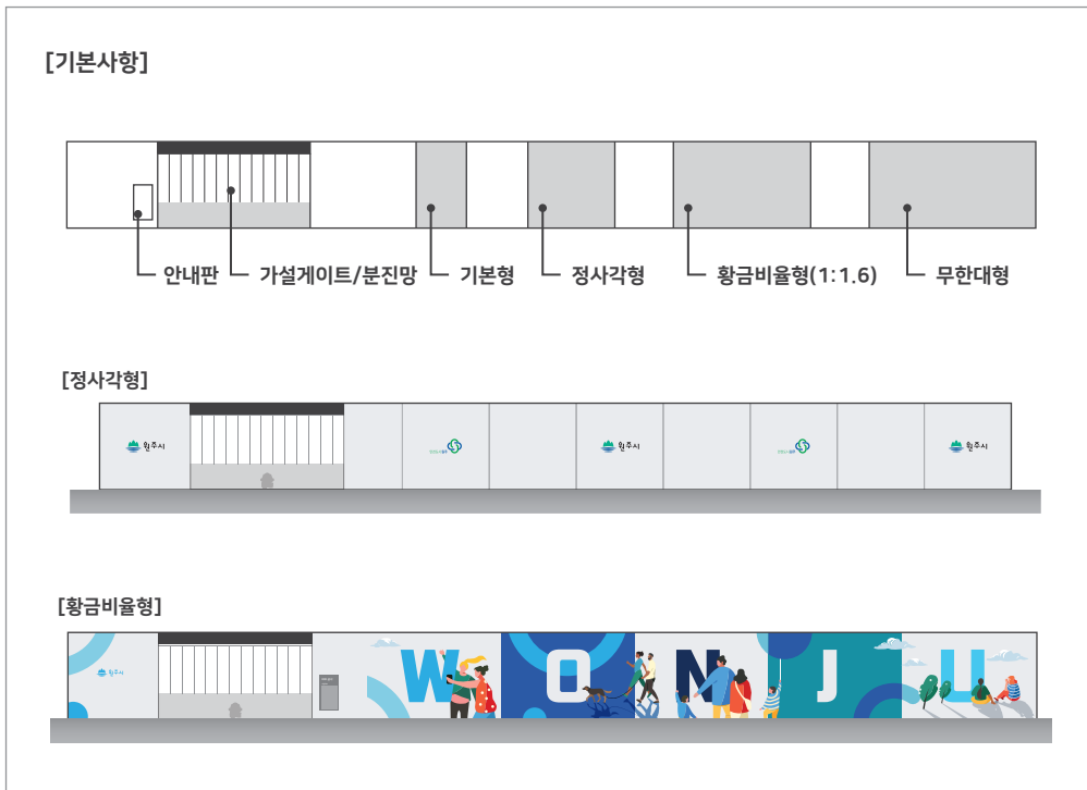
[그림 10] 공사장 가설울타리 설치규격